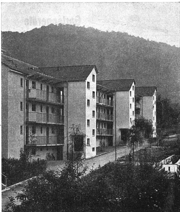
Frühere Bauetappe mit Außenganghaus

Es mag seltsam erscheinen, daß die Familienheim-Genossenschaft, deren Spezialität im Bau von Einfamilienhäusern bestanden hatte, überhaupt dazu kam, sich auf den Bau von Kleinstwohnungen zu verlegen. Der Grund lag darin, daß häufig, besonders von kinderreichen Familien, der Wunsch nach einer kleinen Wohnung kam, sei es für eine Tochter oder einen Sohn, die sich selbständig machen wollten, sei es für die Eltern selber, denen die Kinder nach und nach ausgeflogen waren. Tatsächlich sind heute von den 54 Wohnungen