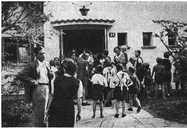
Die Kleinen feiern mit Spiel und „Zabig“ ...