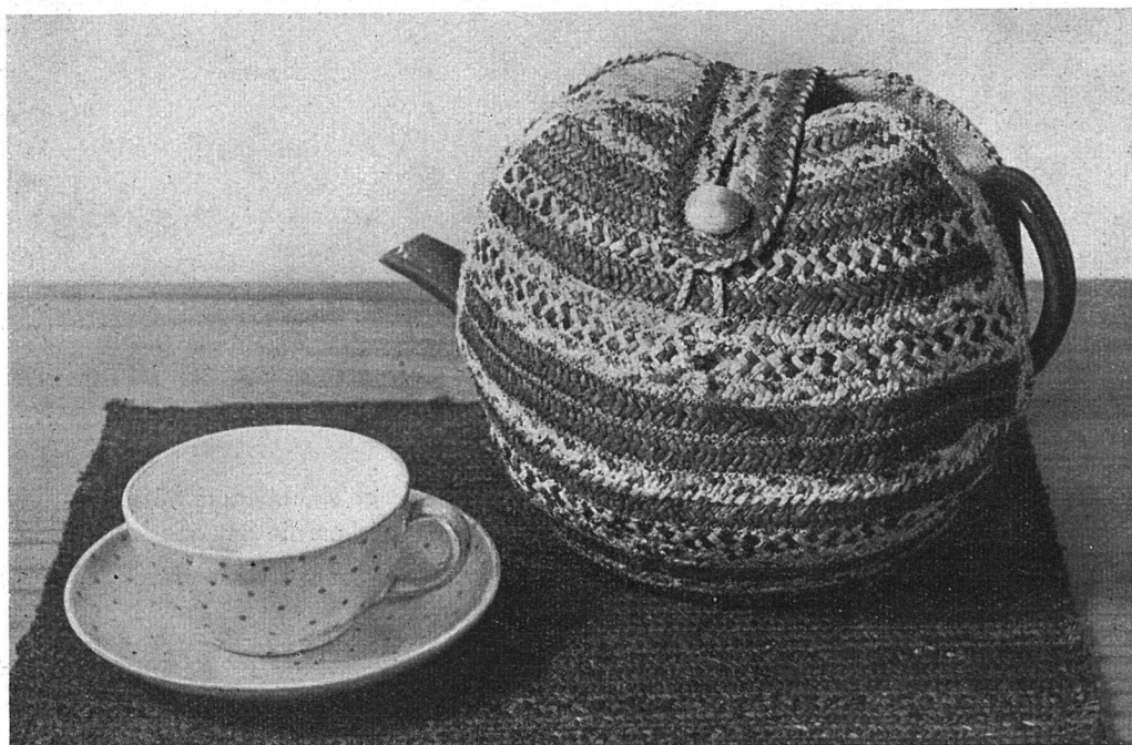
Ein Teewärmer aus farbigem Bast. Solche schöne Bastarbeiten werden heute wieder im Tessin gemacht.