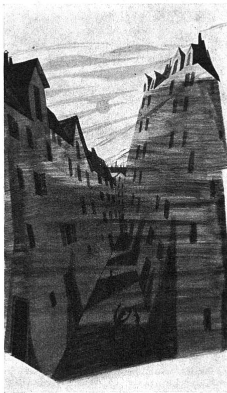
Darstellungsprobe aus der Ausstellung

oder mußte sich die Ausstellung nicht viel eher an alle jene richten, die als Wohnungspolitiker oder Mieter an der zweckmäßigen und vorteilhaften Wohnraumbeschaffung interessiert sind? Die Entscheidung fiel, wie es der Titel der Veranstaltung besagt, zugunsten desjenigen Bürgers, der nicht als Bau- oder Planungsfachmann ein berufliches Interesse an der Bautätigkeit und deren fortschreitender Entwicklung hat. Der Entscheid fiel zugunsten des einfachen Mannes, zugunsten der gesunden Familie, die den Bestand eines tatkräftigen Volkes gewährleistet. «Für Euch planen und bauen wir.» Dieses Motto wurde daher der Veranstaltung vorausgeschickt.