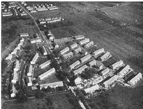
Fliegeransicht während der Bauzeit

Nachdem die Bauabrechnung bei den Subventionsbehörden eingereicht ist, wurde dieser Tage der Wohnbaukommission der Stadt Zürich ein neues Projekt für