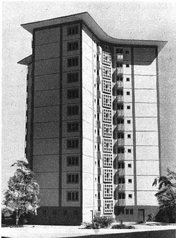
Ost- und Nordfassaden