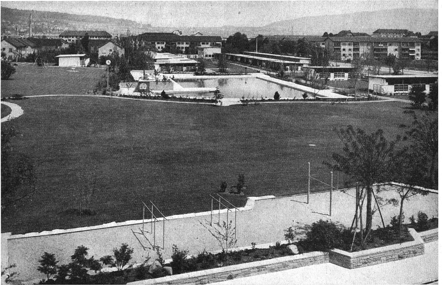
Spielwiese mit Schwimmer-Bassin

Letzigraben entfernt steht das Dienstgebäude, das durch seine Zweistöckigkeit den allgemeinen Eingang betont, und durch seine Stellung, durch das Abrücken von der Bauflucht, eine räumliche Gestaltung des Vorplatzes ergibt. Es enthält die Wohnung für den Abwart und die erforderlichen Räume für das Personal. Der Zustrom der Besucher wird durch ein Zierbassin sogleich nach Geschlechtern geteilt. Die beiden Sammelgarderoben für Männer und Frauen, die 90 % aller Besucher aufzunehmen haben und daher dem Eingang am nächsten liegen, bilden zusammen einen langen Gartenhof, der bereits einen Ausblick auf das Schwimmbecken bietet; die Sammelgarderoben sind in vier architektonische Elemente gegliedert, jedes mit einem kleinen Hof, womit der Maßstab des Intimen erhalten werden soll.