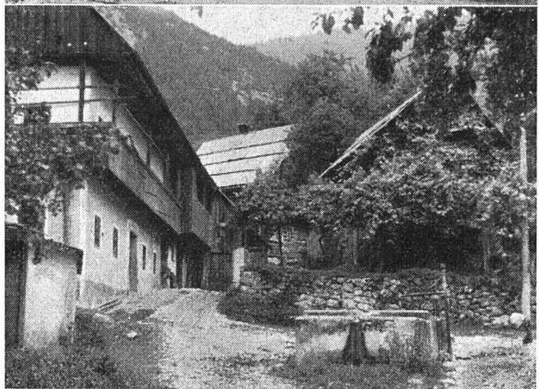
Oben: Vorfabriziertes Einfamilienhaus in Belgrad Mitte: Das Schulhaus in der Pionierstadt Zagreb Unten: Unversehrtes Bauerndorf

sie: «Wir sind glücklich, denn wir wohnen allein.» Sie bezahlt nur 20 Dinar im Monat als Mietzins.