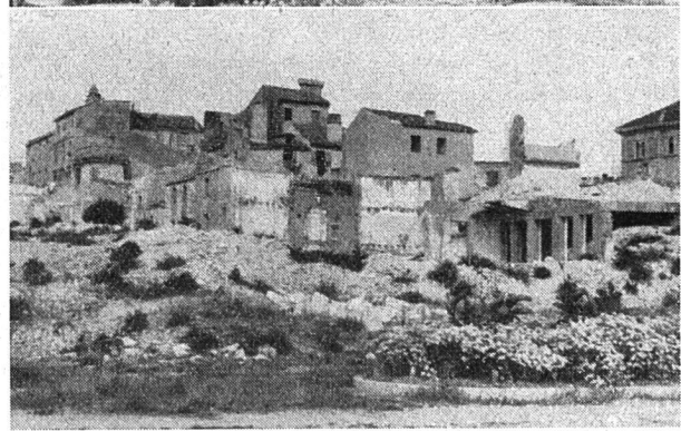
Oben: Im Gebiete von Voiniç, wo nach den Partisanenkämpfen kein einziges Haus mehr bewohnbar war, werden einfache Holzhäuser erstellt