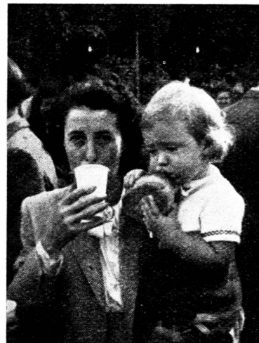
Wir gehören zusammen