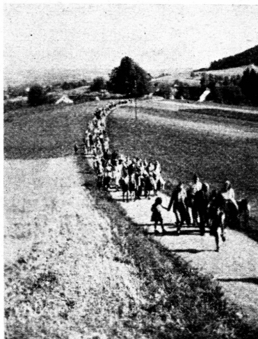
Dem Ziel entgegen

abgestimmt. So fanden sich am frühen Nachmittage des 1. September über 250 fröhliche Kinder und Erwachsene beim Bahnhof Stadelhofen zusammen, um mit der Forchbahn die sonnigen Höhen der Forch zu genießen. Nach einem kurzen Spaziergang ab der Forch fand sich die frohe Schar bei strahlendem Wetter auf dem Waßberg zusammen. Der nahe Greifensee und das Zürcher Oberland mit seinen zahlreichen Ortschaften und Höhenzügen grüßten im lachenden Sonnenschein herüber. Bei mundendem Zabig und regem Spiel und Musik ging die Zeit nur allzu rasch vorüber, um so mehr, als es der Zufall wollte, daß wir mit der Baugenossenschaft «Frohheim» hier oben zusammen verweilen konnten. (Eing.)