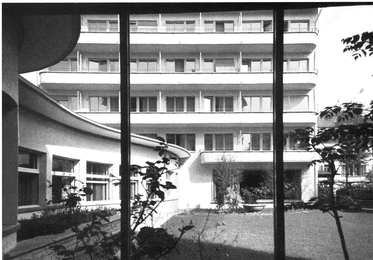
Blick aus dem Windfang des Hauses A (Wohnungen) auf Garten, Restaurant und Haus B (Zimmer)

mag ein möbliertes Zimmer in einer Pension, es mag eine eigene Wohnung sein, jedenfalls bringt es ein gewisses Maß von Arbeit oder aber ein Einordnen in eine lose Gemeinschaft mit, die nicht immer der Natur der Frau entspricht. Was sie braucht und wonach sie sich sehnt, ist ein schützendes Nest, eine aufnehmende, beruhigende Wärme, in welcher sie sich von den Aufgaben des Berufes erholen und neue Kräfte für neue Arbeit schöpfen kann. Mit einem Wort, ein Heim, das