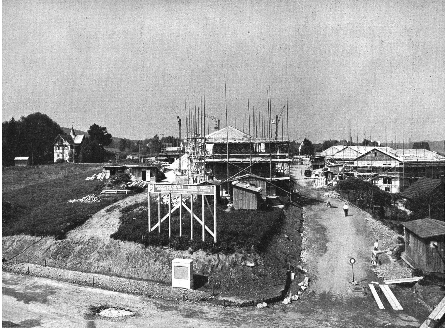
Blick auf die werdende Glättlistraße und die im Bau befindlichen Häuser der VII. Etappe, die nun bereits bewohnt sind. Das Pseudo-Schloß (links oben im Bild), welches längst reif zum Abbruch war, ging in der Zwischenzeit den Weg alles Irdischen und machte den Blöcken der VIII. Etappe Platz