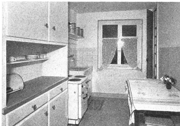
Küche: links Buffet, Herd, Spüle; rechts Speisenschrank, Tisch

ein Korridor mit eingebautem zweiteiligem Wandschrank und genügendem Raum für die Garderobe, ein Putzschrank neben der Wohnungsabschlußtüre.