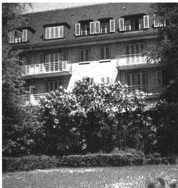
Siedlung an der Wasserwerkstraße

Ein weiteres Kontingent stellen bei den Wohnungsgesuchten die Krankenschwestern. Diese selbstlosen Frauen verzehren ihre Kraft vorzeitig im Dienste der