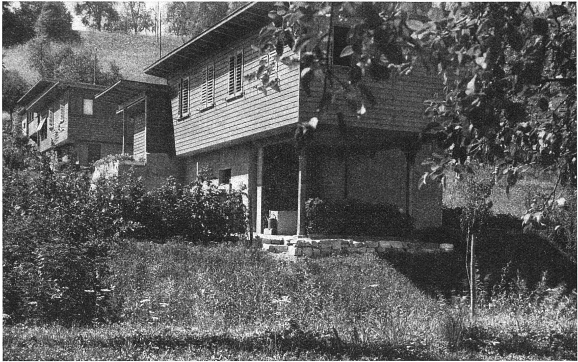
Wohnkolonie «Gwad», Wädenswil

kommt, wo er ortsüblich oder ausführungstechnisch begründet ist, entspricht der neuzeitliche Ständerbau in seinen verschiedenen, je nach Anforderungen modifizierbaren Ausbildungsarten den meisten Bauzwecken. Maschinelle Bearbeitungsmöglichkeiten und das rationellem Bauen zugrundeliegende Streben, einzelne Elemente und ganze Bauten nach Funktion, Konstruktion und Form einheitlich festzulegen, hat zu serienmäßiger Herstellung genormter Bauteile geführt. In der Folge wurde auch bei uns der Tafelbau als industrielle Form des vorfabrizierten Holzhauses entwickelt. Verschiedene Erwartungen hinsichtlich der Verbreitung von Tafelbauweisen wurden in der Zeit des Krieges und der darauffolgenden Jahre bei uns nicht im vorausgesehenen Maße erfüllt. Es muß abgewartet werden, ob die in der serienmäßigen Fabrikation von Holzhausanteilen liegenden wirtschaftlichen Möglichkeiten in der Schweiz einmal wirklich ausgenützt und die dem Montagebau eigenen Gestaltungsprinzipien den bei uns vorherrschenden individuellen Wünschen angepaßt werden können.