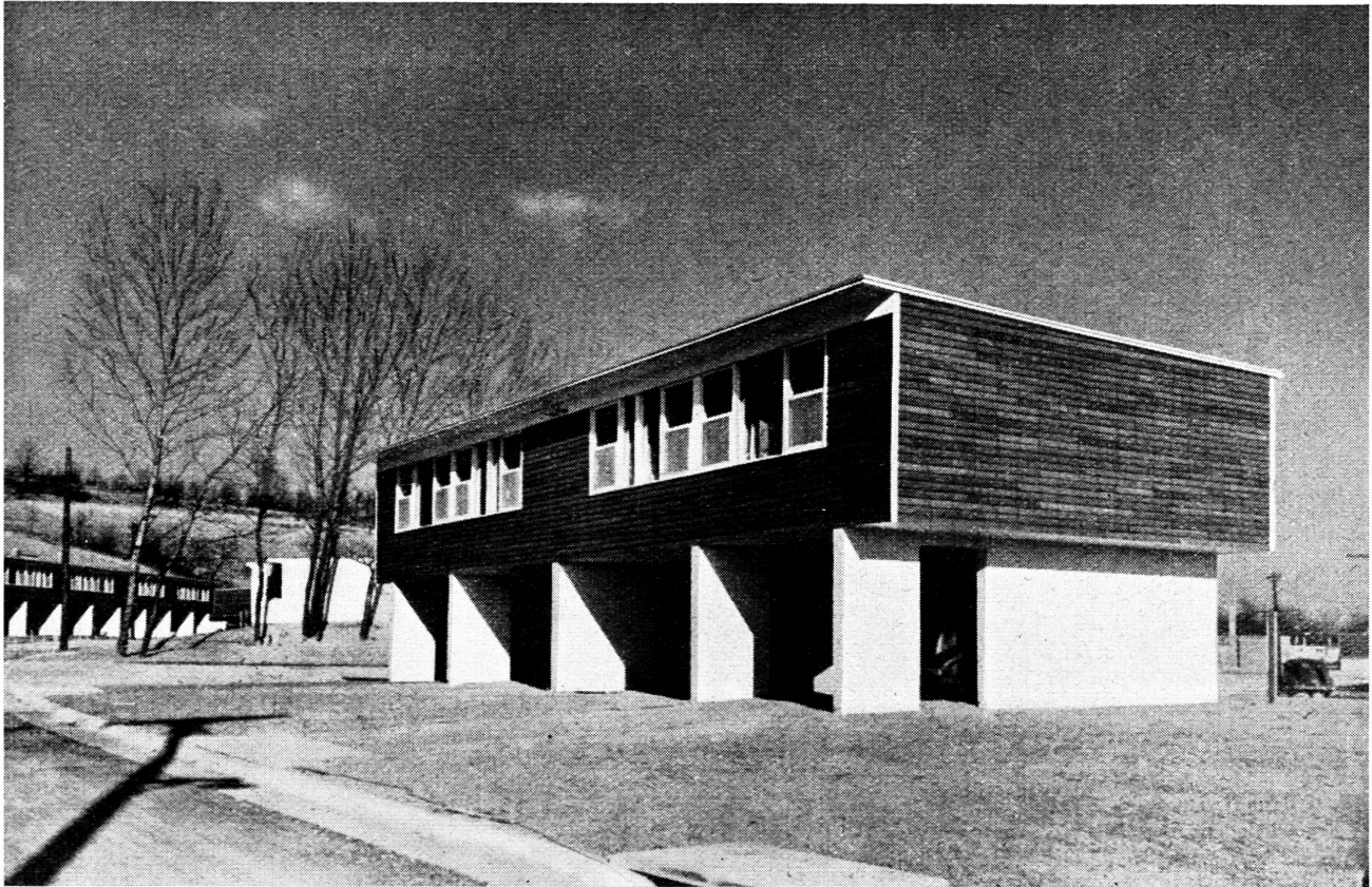
USA baut – Ständerbau mit Einzelwohnungen zu 3 Schlafzimmern

Mitunter harmonieren die neu übertragenen Pflichten nicht ganz mit den ursprünglichen Aufgaben der Organisationen. Einige scheinen auch nicht immer mit richtigem Eifer sich der zugewachsenen Obliegenheiten anzunehmen. Die meisten aber haben durch diesen Zuwachs eine Förderung ihrer Tätigkeit erfahren, die auf weitere Kreise der italienischen Wirtschaft belebend einwirkt. Auch kann nur solche Aufteilung der Funktionen auf eine Vielheit selbst verantwortlicher Träger die nötige Bewegungsfreiheit für ihre individualisierende Erfüllung geben.