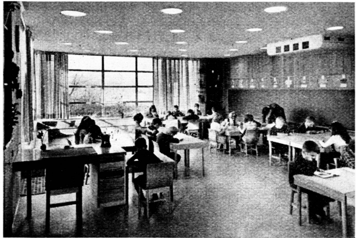
USA baut – Eine moderne Elementarschule