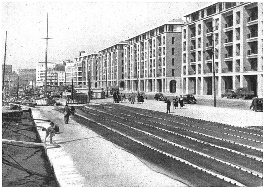
Großzügiger Wiederaufbau des geschleiften Hafenviertels von Marseille

Der Staat und die Gemeinden, aber auch Private, lassen daneben im Erstellen von modernen Wohnbauten eine unverkennbare Großzügigkeit walten. Die französischen Architekten sind kühn, und man läßt sie unbeschwert von allzu vielen Bauvorschriften ihre Ideen verwirklichen. Einen besonderen