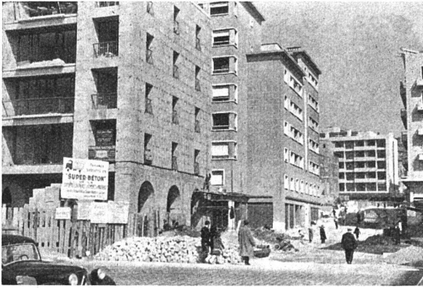
Altstadtsanierung in Marseille – Hier werden die betonierte Häuserfronten mit Marmorplatten verkleidet

Anreiz, großzügige Projekte in die Tat umzusetzen, bieten die vom Krieg verwüsteten Quartiere in einzelnen Städten. Als Beispiel dafür seien hier die großen Wohnbauten in Marseille erwähnt.