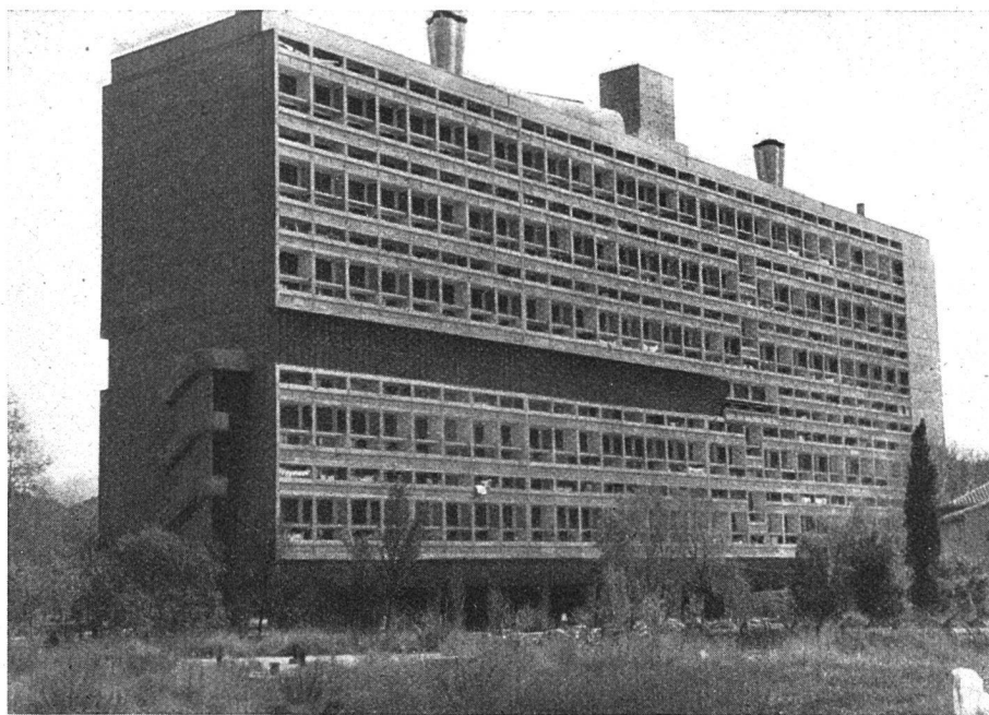
Im Auftrage des Staates durch Architekt Le Corbusier erstellte «Unité d'habitation» in Marseille. Sie enthält ein ganzes Dorf mit Läden, Hotelzimmern, Post, Saal usw.

Wie aus einer kürzlich veröffentlichten Statistik hervorgeht, beträgt in Paris das mittlere Alter der Häuser 83 Jahre, in den Provinzstädten 95 und in den Dörfern auf dem Lande 100 und mehr Jahre. Dabei werden diese alten Häuser meistens nicht — wie bei uns — im Laufe der Jahre von innen heraus erneuert und gepflegt. Man führt nur die notwendigsten Reparaturen aus. 20 Prozent der Häuser in Paris haben kein fließendes Wasser, 54 Prozent haben keine Aborte im Innern, 77 Prozent kein Badezimmer. Man holt sich das Wasser an einem Gemeinschaftsbrunnlein im Treppenhaus