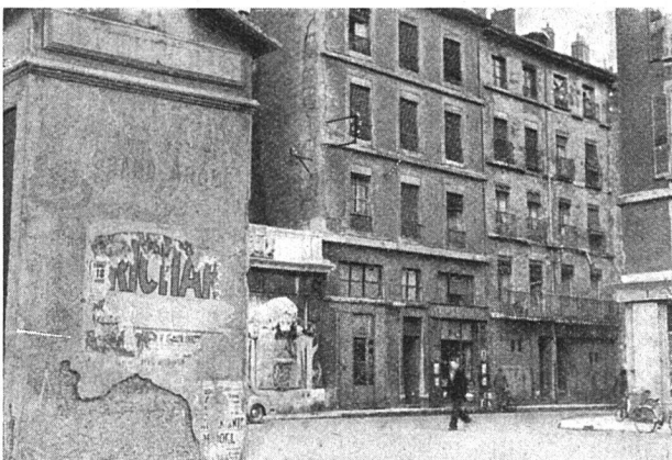
Für Frankreichs Städte typische Wohnbauten – Seit Jahren ließen die Hauseigentümer keine Reparaturen mehr ausführen – (Grenoble)

In großen Zügen geht Le Corbusier von folgenden Gedanken aus: Ideal für das Wohnen in den Städten sind Gar-