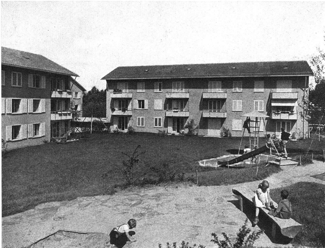
ABZ-Kolonie «Im Moos», Hofansicht nach Süden mit Kinderspielplatz