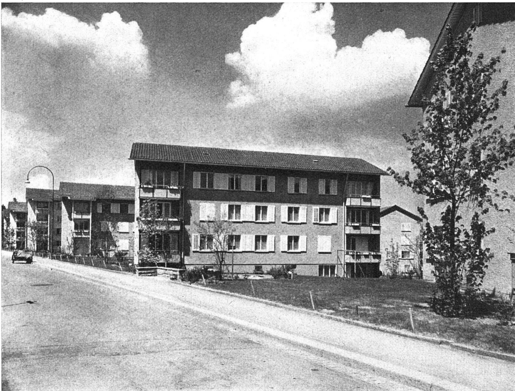
ABZ-Kolonie «Im Moos» Wollishofen – Südansicht Marchwartstraße