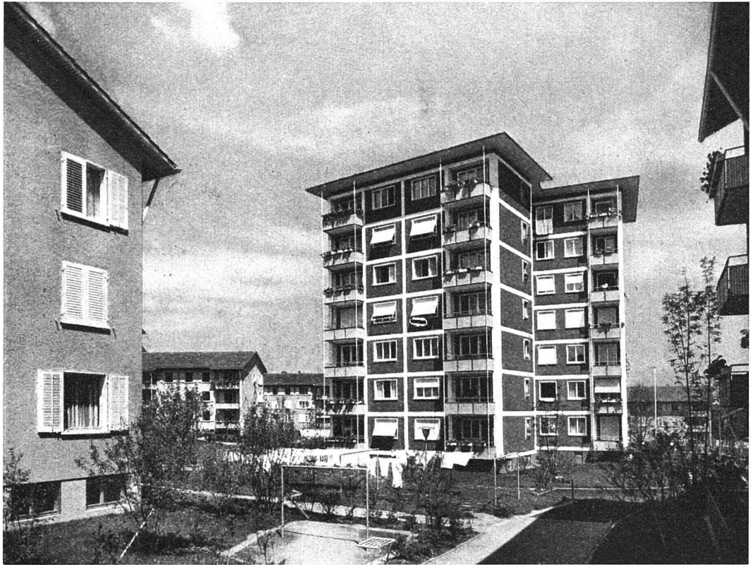
ABZ-Kolonie «Im Moos» Hochhaus gegen Süden, inmitten der Kolonie

Nach einem sorgfältigen grundrißlichen Studium fand Architekt Äschlimann eine Lösung, wonach jeder Wohnung ein Balkon zugeteilt werden konnte. Jedes Hochhausgeschoß enthält zwei 2- und zwei 3-Zimmer-Wohnungen. Eine 3-Zimmer-Wohnung setzt sich zusammen aus dem 17,4 m 2 großen Wohnzimmer, dem 14 m 2 messenden Schlafzimmer, dem 12,4 m 2 betragenden Kinderzimmer und der 7,3 m 2 messenden Küche, was 51,3 m 2 ergibt und der amtlich berechneten Durchschnittsgröße genossenschaftlicher Wohnungen entspricht. Der Wert der Wohnung wird durch den winkelförmigen Korridor noch erhöht, hat dieser doch eine respektable Bodenfläche von fast 9 m 2 .