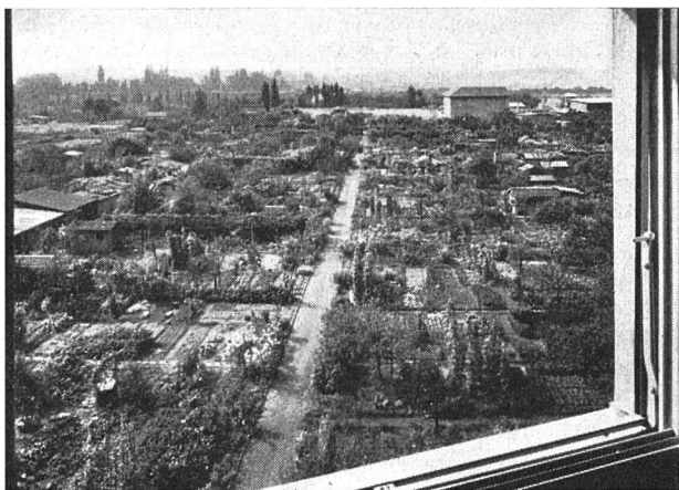
Blick vom 4. Stock Richtung Allschwil-Jura