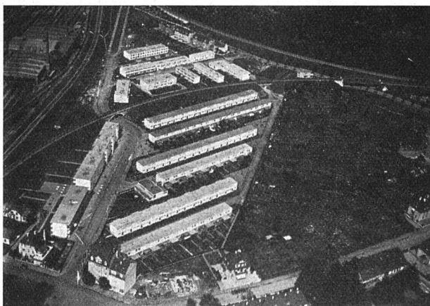
Fliegeraufnahme der Ausstellungskolonie der Schweizerischen Wohnungsausstellung 1930 in Basel

Baurecht und durch Übernahme oder Verbürgung der Nachgangshypotheken.