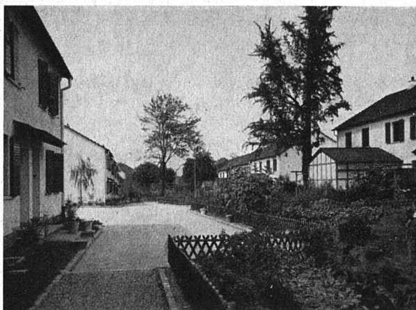
Einfamilienhäuser der Wohngenossenschaft «Zur Eiche» in Basel

Die Aufgaben, welche sich der «Bund der Basler Wohngenossenschaften» bei seiner Gründung gestellt hat, konnten zum größten Teil schon erfüllt werden, an andern wird immer wieder gearbeitet. Neue Probleme werden sich neben den dauernden Aufgaben immer wieder stellen und es ist Pflicht des Vorstandes, diese im Interesse einer gesunden genossenschaftlichen Wohnungspolitik zu lösen.