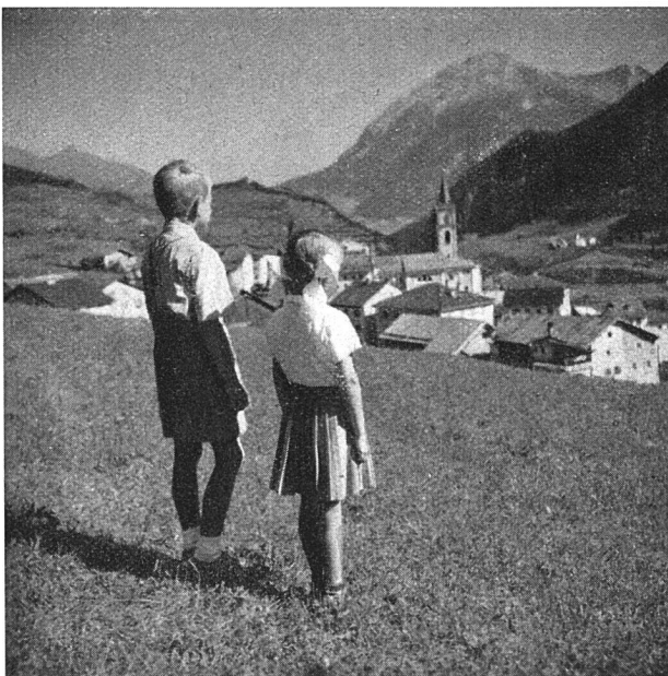
Reams. Blick gegen Lenzerheide

eine Katze herum, die man nicht berühren durfte, weil sie böse sei, sie bekomme nächstens Junge. Da stand ich nun und sehnte mich zurück nach unserer schönen Genossenschaftswohnung daheim. Aber meine «bessere Hälfte» strich mir übers Haar und meinte: «Das ist doch alles nicht so schlimm, das ist halt Ferienromantik!» Er schnitt ein Hölzchen zurecht und flickte den Tisch damit, den Gasrechaud stellte er kurzerhand in den Gang hinaus, so daß der Holzherd benutzbar wurde, schulterte die beiden Kupferkessel und marschierte dem Dorfbrunnen zu. Inzwischen hörte man ein vielstimmiges Bimmeln. Die Kinder stoben davon, dem Geißen-Renato entgegen, der jeden Morgen sämtliche Ziegen des Dorfes auf die Alp führte und sie abends wieder heimbrachte. Den ganzen Salztopf haben sie mir geleert, diese Schleckmäuler, und noch manchen dazu in den folgenden Wochen. Aber wie glücklich waren die Kinder dabei, und auch meine Miene hellte sich zusehends auf, besonders als ich sah, wie die Berggipfel ringsum im Licht der untergehenden Sonne langsam rot erglühten. Wie unendlich schön ist doch die Bergwelt!