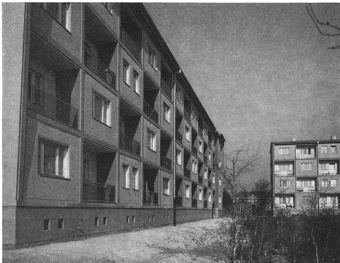
Aus der Siedlung Siemensstadt der Wohnbaugenossenschaft Eintracht

weitgehend der Unterstützung des königlichen Hauses zu verdanken: der Prinz von Preußen übernahm den Vorsitz in ihren Versammlungen und verfolgte ihre praktische Arbeit mit Interesse; auch König Friedrich IV. bekundete sein Wohlwollen (Allerhöchste Cabinets-Ordre vom 26. September 1849: ‚Ich nehme lebhaften Anteil an den Bestrebungen der gemeinnützigen Baugesellschaft und habe zur Bestätigung beschlossen, das Unternehmen durch Zeichnung von 2000 Thlr.-Actien und Bewilligung eines Beitrages von 200 Thlrn. jährlich, welche der geheime Kämmerer Schönung zahlen wird, zu unterstützen. Ich mache dies dem Vorstände der Gesellschaft auf seine an mich gerichtete Vorstellung hierdurch bekannt und wünsche den verdienstlichen Bemühungen desselben die reichsten Erfolge. Sanssouci, den 26. September 1849. Friedrich Wilhelm‘). So wesentlich wohl die Unterstützung