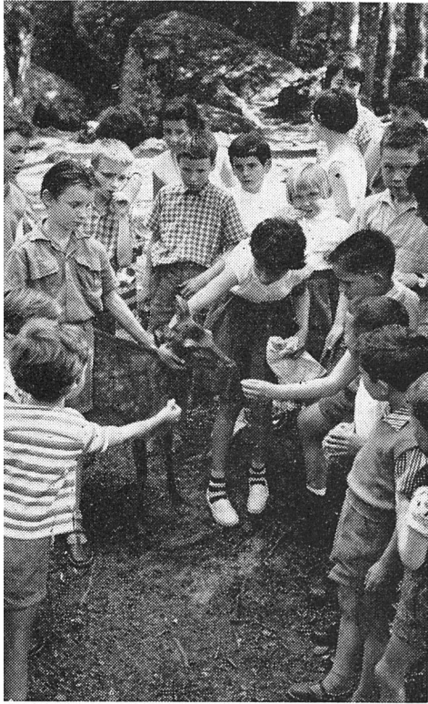
«Bambis inmitten der Jugend

35 Jahre Allgemeine Baugenossenschaft Luzern