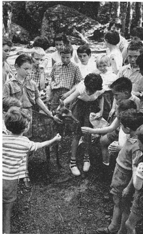
«Bambis inmitten der Jugend

35 Jahre Allgemeine Baugenossenschaft Luzern