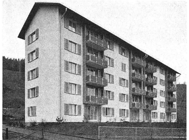
Wohnblock der Allgemeinen Baugenossenschaft Kriens

Nachdem dieses Jahr die Delegiertenversammlung des Schweizerischen Verbandes für Wohnungswesen in Luzern stattfindet und daselbst seitens der Sektion Innerschweiz vorbereitet und durchgeführt wird, ist es am Platze, aufzuzeigen, in welcher Weise der Gedanke wohnbaugenossenschaftlicher Selbsthilfe in der Innerschweiz Wurzeln faßte und zur Tat wurde. Man sieht dabei, daß der Funke bereits in jener Zeit zündete, die man, auf den genossenschaftlichen Wohnungsbau bezogen, als Pionierzeit bezeichnet. Denn wir stoßen hier auf die beiden Eisenbahner-Baugenossenschaften in Erstfeld und Luzern, die fünfzig Jahre des Bestehens schon hinter sich haben. Die ganze Entwicklung ist nachstehend ersichtlich, wobei die Gründungsjahre die Rangfolge bilden.