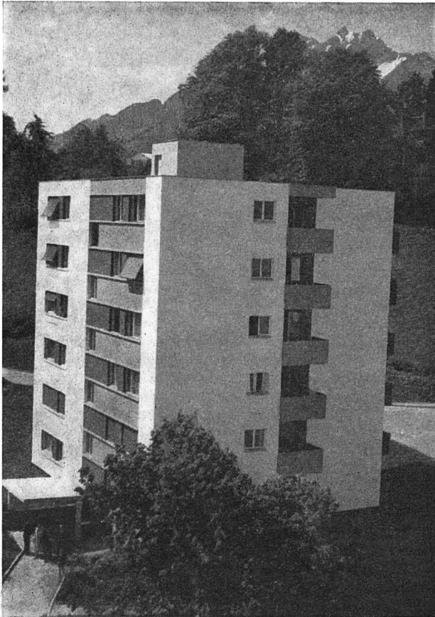
Wohnhaus der Eisenbahnerbaugenossenschaft Luzern auf dem Geißenstein

weitgehendem Maß davon abhängig, wie weit eben dieser «lebendige Geist» (Einstein) verbunden mit dem Willen zu echter genossenschaftlicher Wohngemeinschaft vorhanden ist. Die meisten Wohnbaugenossenschaften sind relativ jüngeren Datums, und als Selbsthilfeorganisationen der Mieter in der Zeit der Wohnungsnot entstanden. Wie oft gab es darum vielfach recht zufällige Vorstandswahlen. Es mußten Funktionen von Genossenschaftlern ausgeübt werden, die weder praktisch noch geistig im Sinne der Genossenschaft vorbereitet waren. Andererseits finden sich arbeitsfreudige Mitarbeiter, welchen jedoch der geistige Boden der Genossenschaftsbewegung fehlt. Bei den nun schon seit einigen Jahrzehnten bestehenden Genossenschaften sind die Vorstände heute mit älteren Genossenschaftlern besetzt. Mit dem Abtreten dieser älteren Generation entsteht die Nachfolgefrage. Wo finden sich die neuen Funktionäre, die mit dem genossenschaftlichen Gedankengut vertraut sind? Es sei daran erinnert, daß auch erhebliche materielle Werte, wie Genossenschaftskapital und im Laufe der Zeit angesammelte Reserven, zu verwalten sind. Dadurch entstehen große materielle Verpflichtungen sowohl gegenüber den eigenen Mitgliedern wie auch gegenüber Dritten. Gerade die Frage der Nachwuchsförderung ist bei der Beratung dieses neuen Arbeitsgebietes im Vordergrund gestanden.