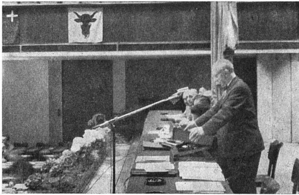
Der Präsident eröffnet die Delegiertenversammlung

Tausende von Familienvätern außerordentliche Schwierigkeiten, ihrem Einkommen entsprechende Wohnungen zu finden. Die Wohnungsnot dauert an. Es ist auf Grund der letzten vom Bundesrat gefaßten Beschlüsse zu erwarten, daß die Mietpreise während der nächsten vier Jahre weitere Erhöhungen erfahren werden und auch die in Aussicht stehende Verteuerung von Lebensmitteln (Milch, Fleisch usw.) die Lebenshaltungskosten stark beeinflusst.