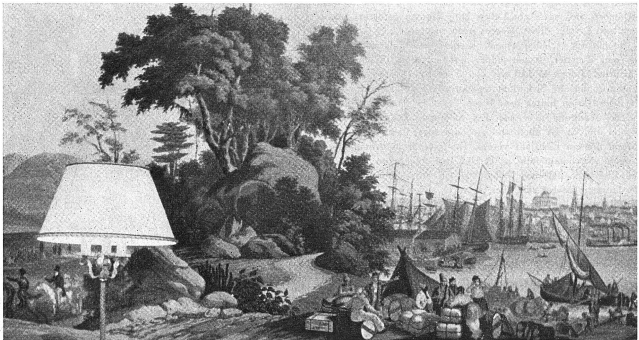
Alte französische Bildtapete.

Der Mensch von heute, vor die Aufgabe gestellt, sein Leben und Wohnen nach seinen Wünschen zu gestalten, wird alles daran setzen, eine möglichst persönliche und geschmacklich einwandfreie Lösung dafür zu finden. Er wird die allgemeine Richtung zur Abstraktion und Nüchternheit teilweise bejahen, doch ebenso gewiß die allzu doktrinaire und uniforme Unpersönlichkeit verneinen.