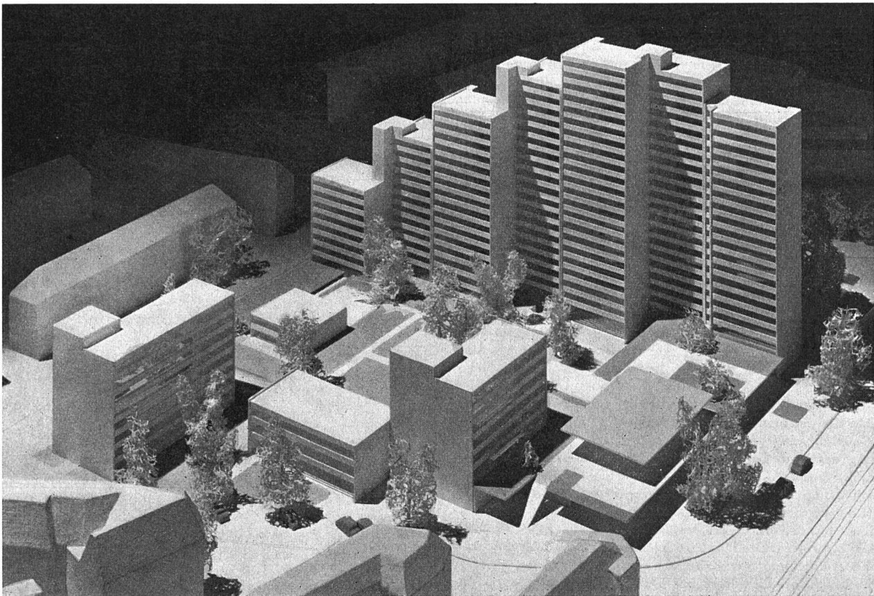
Vom Regierungsrat um drei Geschosse reduziertes definitives Projekt mit 351 Wohnungen.