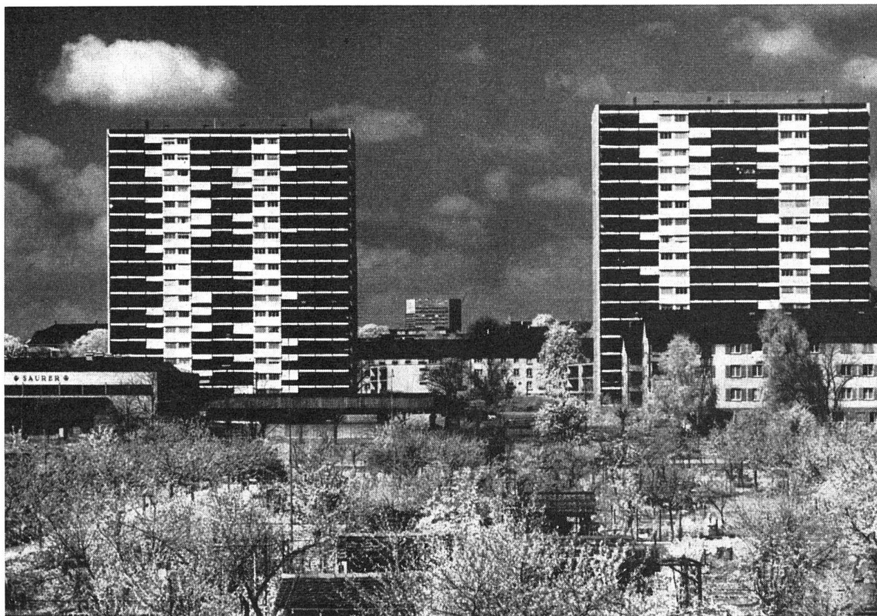
Moderne Wohnbauten am Basler Stadtrand