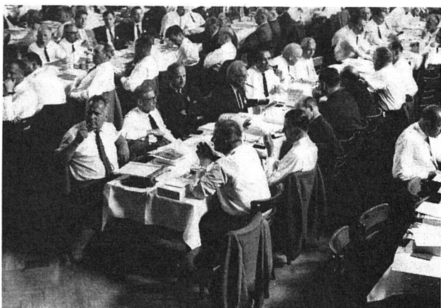
Die Tische der Gäste und der Presse