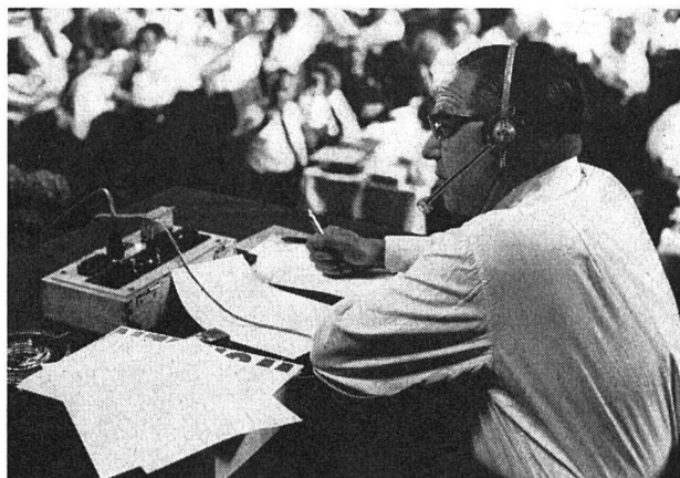
Eine Neuerung: Zum erstenmal folgten unsere welschen Freunde den Verhandlungen unter Mithilfe einer Simultan-Übersetzungsanlage

mit großem Beifall aufgenommene Referat, dem auch entnommen werden konnte, wie kompliziert und vielgestaltig heute die Probleme liegen. Das Wort wird für die Diskussion freigegeben.