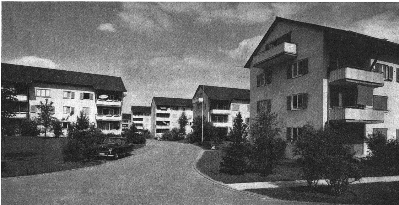
Siedlung «Kornfeldstraße» der Wohnbaugenossenschaft Brugg/Windisch

Bereits zeichnen sich einige weitere Möglichkeiten ab, die allerdings im Hinblick auf die Entwicklung unserer Region genau analysiert werden müssen. Obschon wir in diesen zehn Jahren manches hart erarbeiten mußten, haben wir allen Grund, mit dem Erreichten zufrieden zu sein. W. H.