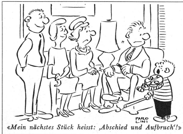
«Mein nächstes Stück heisst: „Abschied und Aufbruch!“»