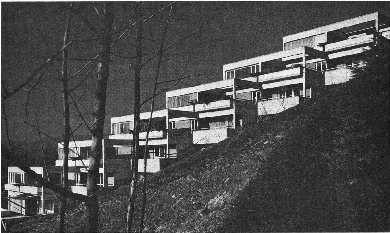
«Im Himmelrich», Baar