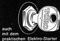
auch mit dem praktischen Elektro-Starter