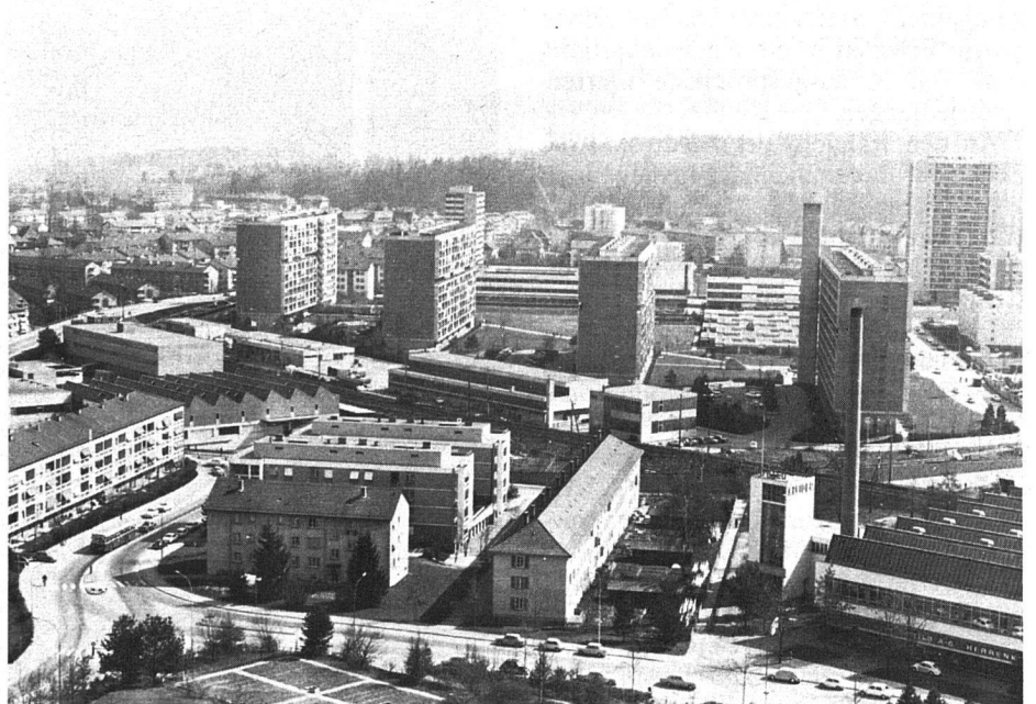
Ein Symbol des neuen Bern: Die Überbauung Schwabgut. Im Block links das Betagtenheim Schwabgut, eingefügt in die Gross-Überbauung.