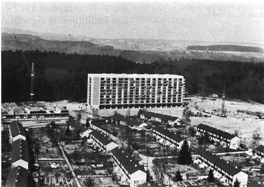
Überbauung Bethlehemacker Scheibenhäuser S1. Eigentümerin: Fambau Bern und Private. Rechts die Baustelle für das Hochhaus H2 der Fambau Bern (163 Wohnungen). Bezug der Wohnungen ab Februar 1973 – Mietzinszuschüsse von Bund, Kanton und Stadt Bern. Mietzins einer 4-Zimmer-Wohnung ab Fr. 650.– brutto.

Moderne Quartiere und neue Projekte wie Tscharnergut, Ausserholligen, Gäbelbach, Schwabgut, Bethlehemacker und Fellergut, um einige Beispiele zu nennen, sind mit ein Ergebnis der Tätig-