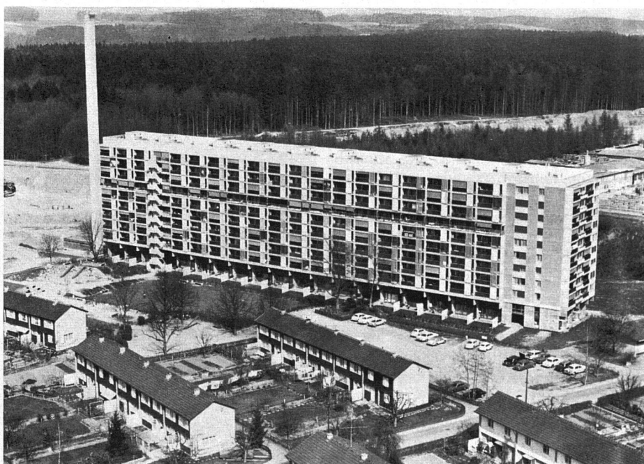
Überbauung Bethlehemacker, Scheibenhäuser S2. Eigentümerin: Siedlungsgenossenschaft der Holzarbeiter-Zimmerleute des SBHV und Private. Bezug 1969/70. Die Einfamilienhäuser vorn gehören der vorgenannten Baugenossenschaft und der Familienbaugenossenschaft Bern. Mietzins im Scheibenhäuser: 4-Zimmer-Wohnungen brutto ab Fr. 530.– pro Monat.