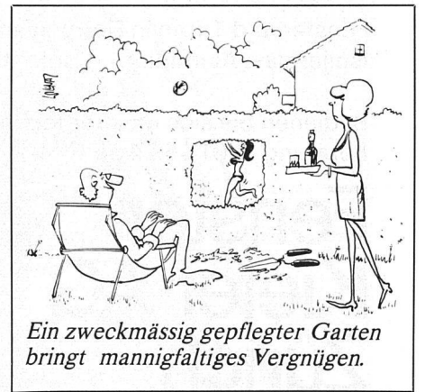
Ein zweckmässig gepflegter Garten bringt mannigfaltiges Vergnügen.

Viele Hausbesitzer wundern sich aber, dass die Nistkästen, die sie aufgehängt haben, den Sommer über leer bleiben. Bei neuen Kästen wird das selten der Fall sein. Es wäre denn, man hätte sie aus