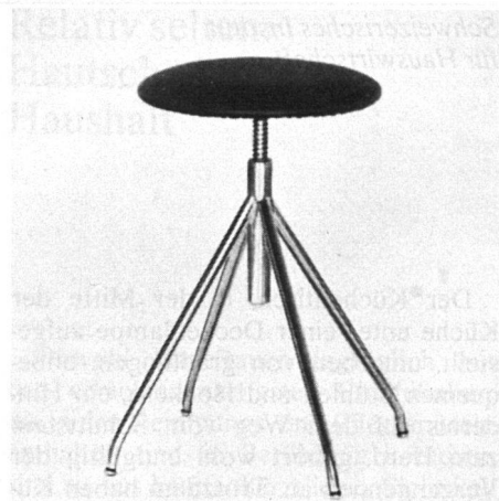
Drehhocker sind platzsparend und lassen sich der Arbeitshöhe anpassen.

Muskularbeit. Falsches Sitzen macht müde und kann sogar Haltungsschäden nach sich ziehen.