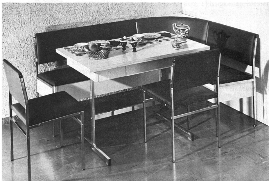
Oben: Säulentisch, erlaubt bei Eckbänken ein bequemeres Absitzen

Die Küchentische ruhen auf vier Eckfüssen, 2 verstrebenen Säulenfüssen oder einem Säulenfuss. Wichtig ist die unbe-