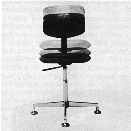
Universalstuhl mit verstellbarer Sitzhöhe und Rückenlehne.