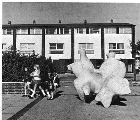
Futuristische Skulptur und moderner Wohnungsbau in Stevenage. Die Mehrzahl der Bewohner der Neuen Städte lebt in zweistöckigen Häusern, die meist als Reihenhäuser angelegt sind. Einzelstehende Bungalows und mehrstöckige Wohnhäuser sind selten.

geeignet sein, d.h. sie müssen entweder im Parterre oder im ersten Stock von normalen oder zweckentsprechend gebauten Wohnblocks liegen, oder es muss sich um spezialentworfene Häuser und Bungalows handeln.