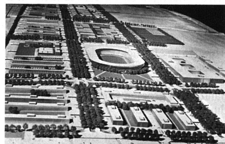
Modell der 1967 projektierten Neuen Stadt Milton Keynes. Sie erstreckt sich über eine Fläche von 8500 Hektar und umfasst die Städte Stony Stratford, Wolverton und Bletchley in Buckinghamshire. Als Planziel wurde eine Einwohnerzahl von 250 000 Menschen festgesetzt.

Bei der ersten Generation von Neuen Städten war der Prozentsatz an Mietwohnungen sehr viel grösser, da befürchtet wurde, dass andernfalls zu viele Menschen dort hinziehen würden, die lediglich nach London pendeln, sich