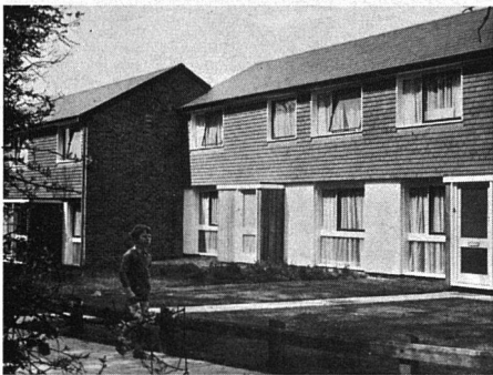
In Fertigbauweise erstellte Wohnhäuser in Crawley. Die von den Entwicklungsgesellschaften gebauten Häuser werden meist preisgünstig vermietet. Inzwischen jedoch hat auch der Anteil der zum Verkauf stehenden Häuser zugenommen.

Wohnblocks sind in den Neuen Städten nur selten anzutreffen; es gibt sie entweder auf Eckgrundstücken in Wohngebieten oder als Hochhäuser, die visuelle Akzente setzen und Abwechslung in das Stadtbild bringen sollen.