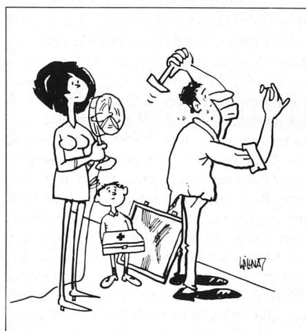
Do-it-yourself-Anfänger jedoch sollten bei Ausübung ihres Hobbies gewisse Vorsichtsmassnahmen treffen...