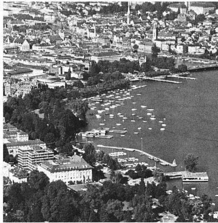
Geschlossene Grünzüge verbessern das Stadtklima und sind wichtige Gliederungs- und Ordnungselemente.

Die Städte wuchsen. Die Industrien frassen riesiges Gelände der Landschaft, um es mit Bauten, Strassen, Lagerplätzen und Eisenbahnlinien zu bedecken. Überall musste die ursprüngliche Landschaft, mussten Baum und Strauch dem Stein, dem Asphalt, dem Beton weichen. Der Verkehr wuchs und die Städteplanung bewegte sich betont auf technischem Gebiet. Überall wurden Strassen verbreitert, Parkplätze und Garagen gebaut, immer im Glauben, autogerechte