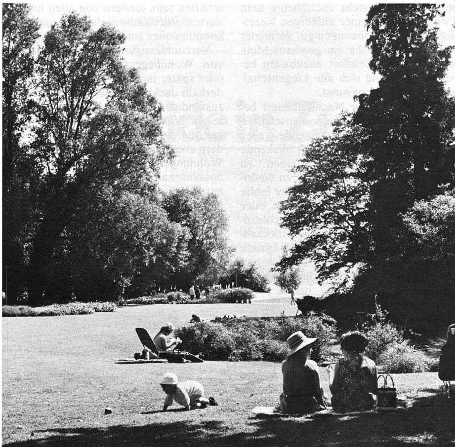
Unbeschwertes Leben im weiten Erholungsgrün.

Städte zu schaffen. Täglich ratterten und kreischten die Sägen, splitterten die Äste, wurden Bäume an den Strassen, in den Vorgärten und den Grünanlagen unserer Städte gefällt - alles spannte gleichsam zusammen in einem Kampf gegen die Reste der Natur in der Stadt.