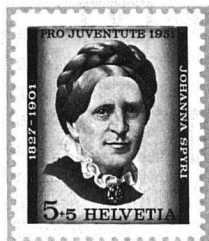
Johanna Spyri 1827-1901