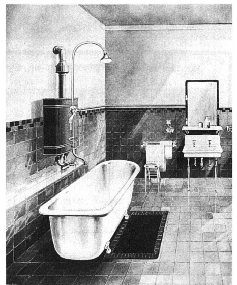
Luxusbad vor 50 Jahren

«Es ist zu betonen, dass die Bademöglichkeit durch die Einrichtung eines eige-