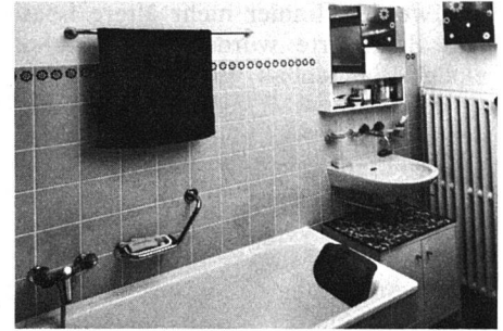
Badezimmer wie oben, renoviert 1973