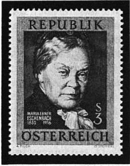
Marie von Ebner-Eschenbach 1830-1916

Das Leben dieser österreichischen Erzählerin verlief ähnlich wie jenes von Tausenden von Frauen adeliger Abstammung zurzeit der österreichischen Donaumonarchie und verdiente deshalb hier keine besondere Erwähnung. Da sie aber trotz aller inneren und äusseren Verwurzlung in der habsburgischen Landaristokratie menschlich ergreifende Schicksale schilderte aus der kleinen Welt des Dorf- und Schlosslebens, verdient sie an dieser Stelle eine Würdigung.