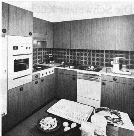
Renovierte Essküche

Glücklicherweise setzt sich der Trend zur grösseren Küche immer mehr durch. Die Proteste vieler Hausfrauen, Hauswirtschaftslehrerinnen, Frauenorganisationen und Küchenbauer scheinen Früchte zu tragen. Viele Architekten planen nun die Küche in einem Neubau zusammen mit dem Küchenbauer und räumen ihr auch mehr Quadratmeter als in der Vergangenheit ein.