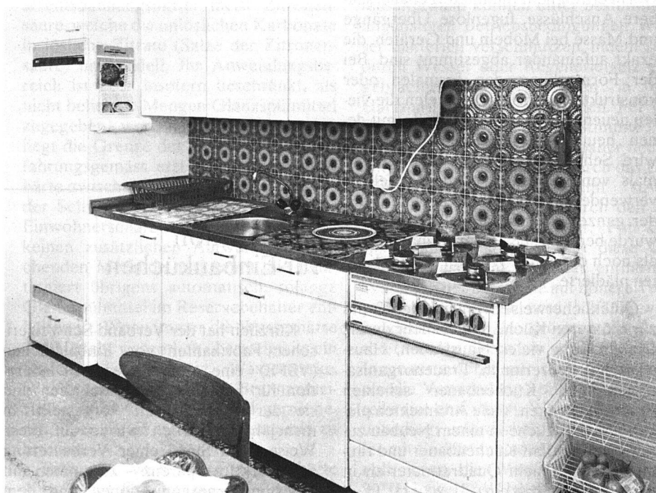
Modernisierte Gasküche in einer Altbau-Siedlung

festlegen. Dabei gingen die Konstrukteure von einer sehr logischen Form aus, von einem Quadrat. Die Gesamttiefe der Küchenmöbel wurde auf 60 cm festgelegt, ein Mass, das später in allen übrigen Ländern übernommen worden ist. Beim 60 cm tiefen Arbeitskorpus steht die Abdeckung vorne um 2 cm über die Vorderfront der darunter liegenden Schränke. Die Türen dieser Schrankelemente mes-