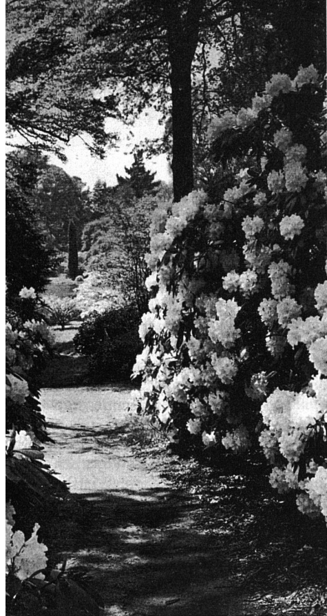
Oben: Rhododendron-Pfad in Wisley Gardens

Rechts: Administrations- und Laborgebäude von Wisley Gardens im traditionellen englischen Stil, reich mit seltenen Kletterpflanzen bewachsen