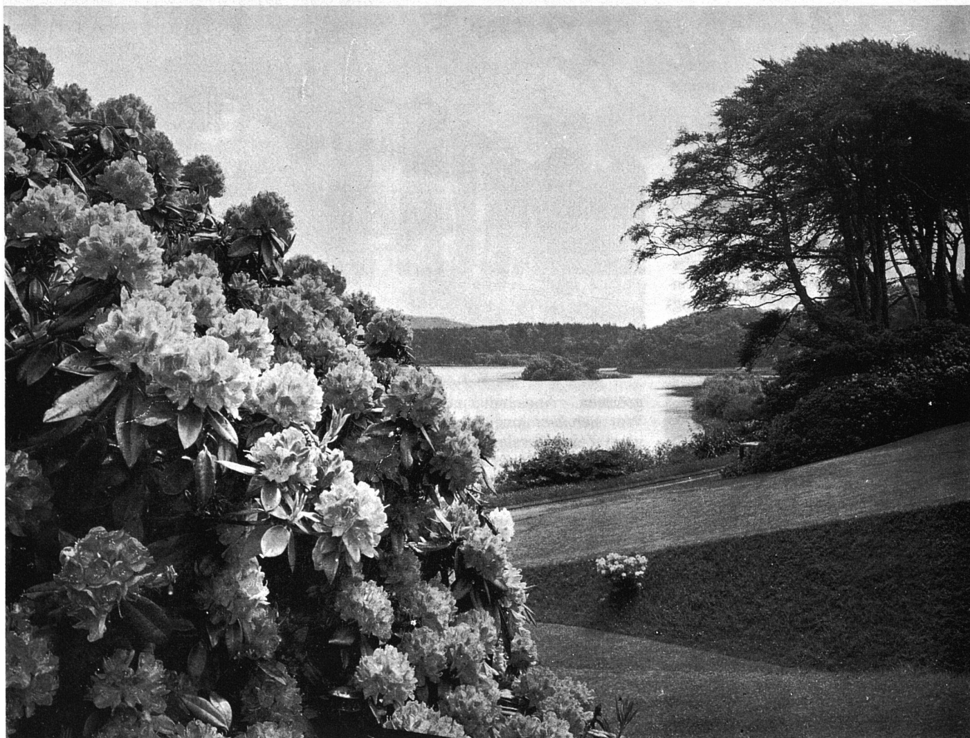
Englische Parklandschaft mit Rhododendrons und kleinen Seen im Valley Garden

Wenn die Gärten in England heute auch immer kleiner werden, so findet man doch auf kleinstem Raum noch Rasen, bunte Blumenrabatten und sehr oft ein Kleingewächshaus. Für die Rhododendron- und Staudenfreunde sind die reichen grossen Parkanlagen des englischen Landadels aus dem 17. und 18. Jahrhundert besondere Fundgruben. Allerdings hat die veränderte Wirtschaftslage Grossbritanniens auch hier Probleme gebracht. Für viele der Grossgrundbesitzer ist der Unterhalt der Schlösser, Villen und der grossen Gärten zu einer unerträglichen Bürde geworden. Bei nachweisbar kulturhistorischem Wert können solche Güter heute dem Natio-