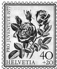
Ein Beispiel aus der neuen Marken-Serie