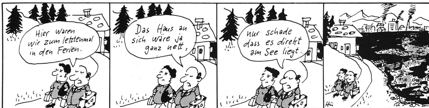
Schweiz Vereinigung für Gewässerschutz und Luftthygiene Aktion Saubere Schweiz