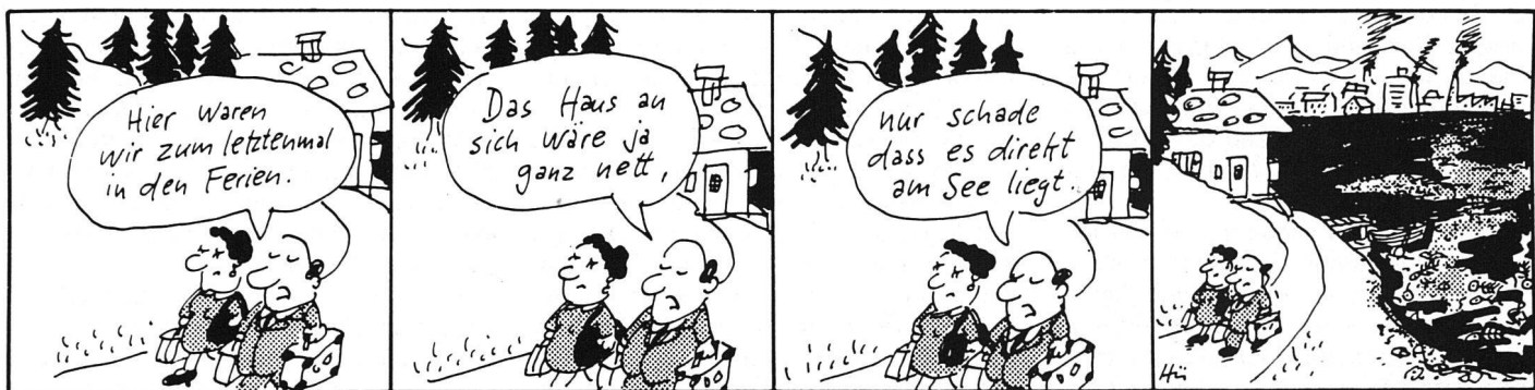
Schweiz Vereinigung für Gewässerschutz und Luftthygiene Aktion Saubere Schweiz