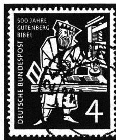
Gedenkmarke der BRD von 1954, aus Anlass der 500jährigen Gutenberg-Bibel.

Gutenbergs Bibelausgabe ist sowohl in Gestaltung und technischer Ausführung heute noch beispielhaft. Seine Erfindung ermöglichte die rasche Entwicklung des Buch- und Zeitungsdruckes, als Grundlage der allgemeinen Volksbildung. Es ist wohl nicht übertrieben, wenn angenommen wird, dass allein mit der neuen Buchdruckerkunst die Ausbreitung der Reformation überhaupt möglich geworden ist. Das Bildungsmonopol der Klöster und einzelner weniger Standes-Lateinschulen wurde durch die Erfindung Gutenbergs gebrochen. -fm-