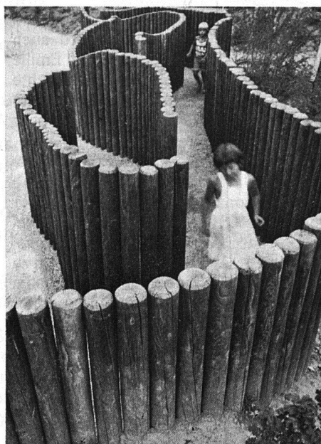
Sandgruben zum Bauen, Hartflächen für Autos und Dreiräder und ein «raumartiges» Bewegungsfeld charakterisieren die Spielwelt des Kleinkindes.

Der kindlichen Phantasie sollen kaum Grenzen gesetzt und die angebotenen Variationsmöglichkeiten sollen stets einen Impuls zum Experimentieren auslösen.