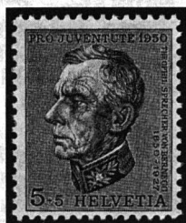
Theophil von Sprecher

Die aus der Innenstadt verdrängten und die aus den Abruzzen und dem Süden «geflüchteten» Italiener leben in unfreundlichen Aussenquartieren, wo ganze Viertel ohne irgendwelche Stadtplanung und ohne Baubewilligungen wie Pilze nach einem warmen Sommerregen aus dem Boden schossen. In gewissen Aussenquartieren Roms kann man auf riesige Wohnblöcke stossen, die keine