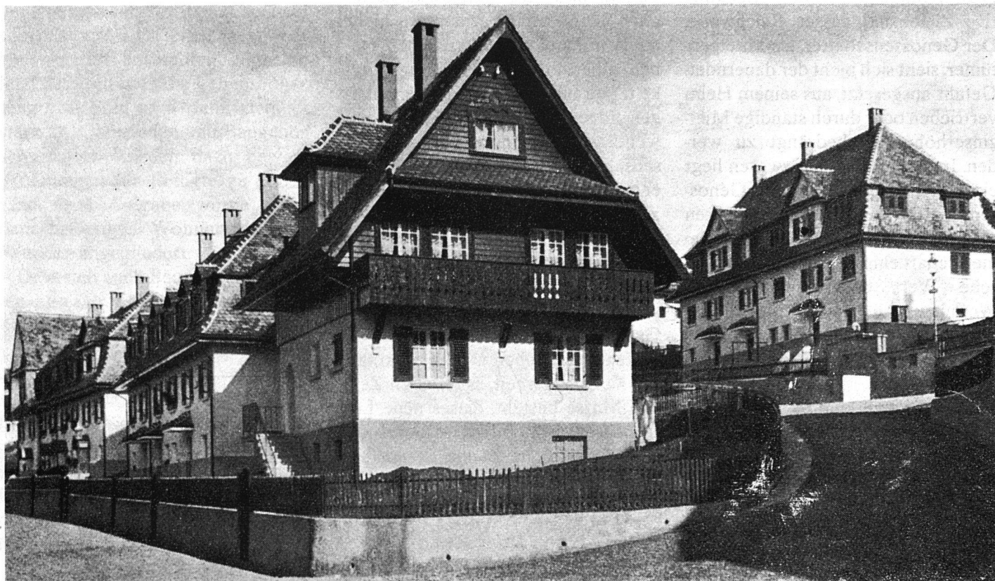
Bild unten: Genossenschaftlicher Wohnungsbau zur Gründungszeit des Schweizerischen Verbandes für Wohnungswesen (zeitgenössische Photographie).

In der Folge haben sich zahlreiche davon betroffene Baugenossenschaften mit der Bitte um Hilfe an uns gewandt. Rückblickend dürfen wir heute mit Genugtuung festhalten, dass vielen Baugenossenschaften damals mit der Gewäh-