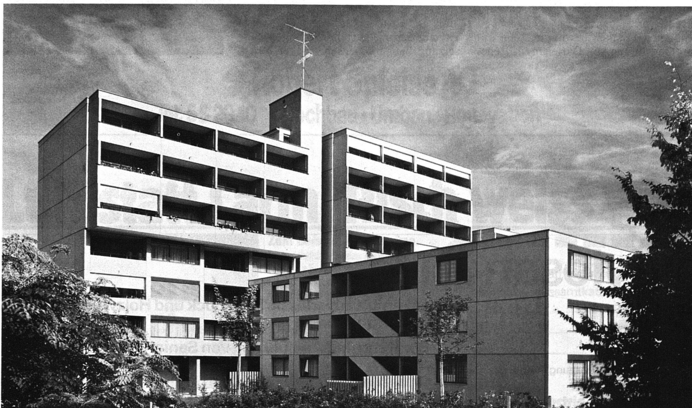
Bild unten: Genossenschaftlicher Wohnungsbau, wie er sich heute, nach 60jährigem Bestehen des SVW, präsentiert.

Ein weiteres unsere Mitgliedgenossenschaften beschäftigendes Problem war und ist die Erneuerung bestehender Wohnungen. Schon bei den Vorarbeiten für die Jubiläumstagung 1969 hat sich unsere Technische Kommission damit befasst. Die TK hat 1970 eine Fachtagung durchgeführt und eine Fachschrift erarbeitet. Sicher dürfen wir heute bei unserem Rückblick auf die letzten 10 Jahre festhalten, dass wir frühzeitig - als andere Kreise noch kaum daran dachten und die Neuerstellung von Wohnungen als weit attraktiver als Renovieren galt - mit unseren Fachtagungen und Veröffentlichungen einen wertvollen Beitrag