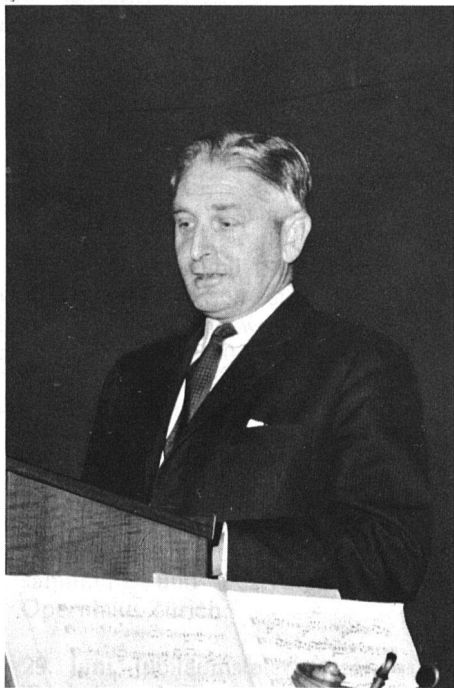
Vor zehn Jahren, zur Feier des 50jährigen Bestehens des Schweizerischen Verbandes für Wohnungswesen in Zürich, entbot der damalige Regierungspräsident und spätere Bundesrat Ernst Brugger die Grüsse der Zürcher Regierung.

und entscheidende Denkanstösse für die heutige intensive Renovationstätigkeit geleistet haben. Sicher hat gerade diese Aktivität mitgeholfen, dass wir bei den zuständigen Behörden des Bundes und der Kantone in den letzten 10 Jahren einiges an Goodwill gewonnen haben und dass unsere Leistungen auch anerkannt werden. Sicher kam es nicht von ungefähr, dass, als das Parlament einen Kredit für Arbeitsbeschaffung von 50 Millionen Franken bewilligte, auch uns zur Gewährung von Darlehen für Reno-